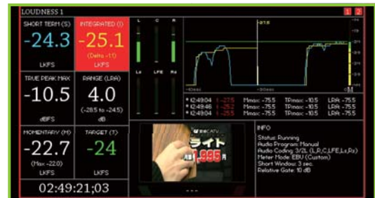
フルスクリーン・モード